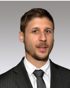
Par Olivier Marinot, Gérant chez MCA Finance

Memscap conçoit, développe, fabrique et commercialise des composants fondés sur les systèmes micro-électro-mécaniques (MEMS). Les 3 marchés principaux sont l'avionique, l'optique et le médical.